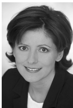
Malu Dreyer, Ministerin für Arbeit, Soziales, Familie und Gesundheit

Familien in Notlagen erhalten dabei über unsere Stiftung "Familie in Not", über ein Sonderprogramm zur Familienferienerholung und über Schuldenberatung besondere Unterstützung. "Menschen pflegen" ist die Qualitätsoffensive im Bereich Pflege, die ich 2003 mit den Partnerinnen und Partnern der Pflege in Rheinland-Pfalz ins Leben gerufen habe und die wir fortführen werden.